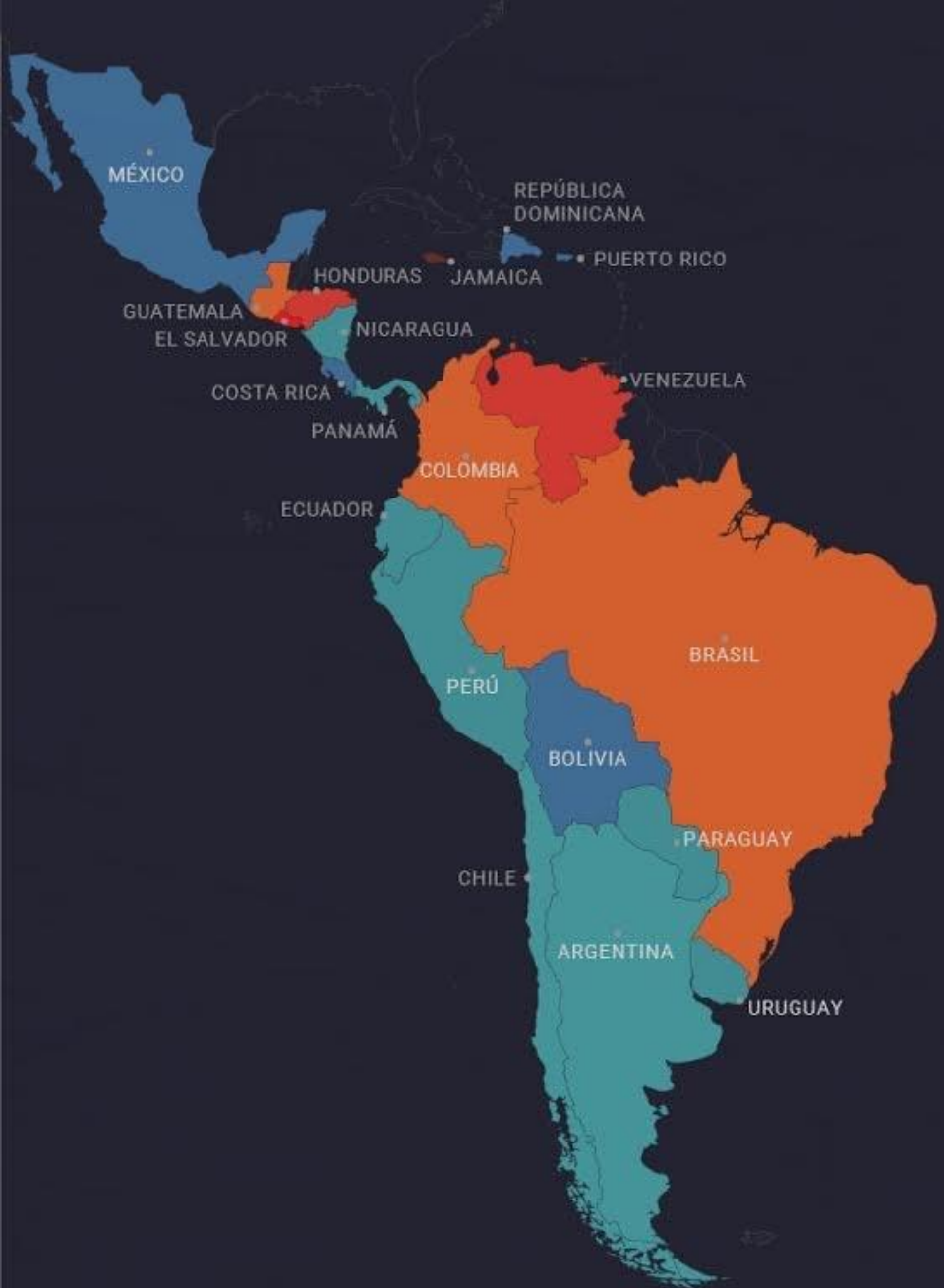
TASAS DE HOMICIDIOS (POR 100.000 HABITANTES)